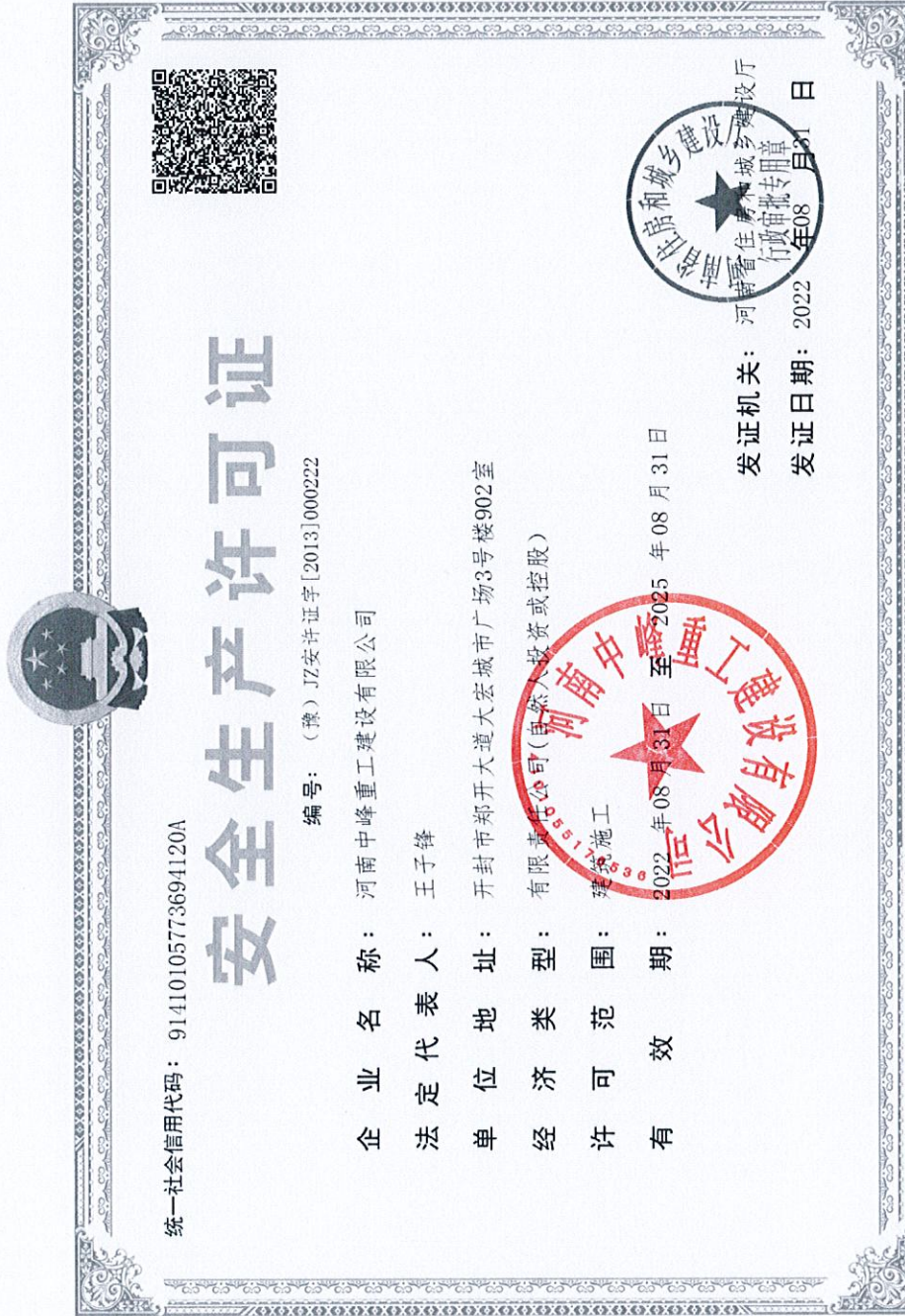
附件 6：安全生产许可证复印件